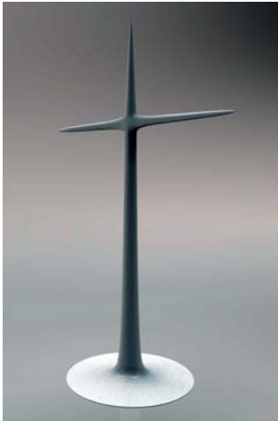
図 7 「あの爆発」谷山示

作品イメージ：掲載用のイメージに関しまして必要な場合は企画担当の岡田(連絡先基本情報参照)にご連絡ください