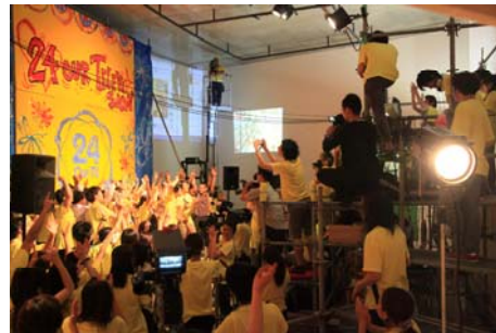
図 5 「24 our Television」ナデガタインスタントパーティー