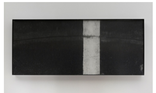
図3 Google Mapが見せる「東京の謎」を切り取る「NIHONBASHI」

様々な人々が創造したアプリケーションを手に入れることで、ライフスタイルに新たな解像度をもたらす、あっと新しい携帯電話の時代。全世界的なアプリケーション開発競争の中、アートやデザインとしてのクリエイティビティーをつきつけることで、グローバルに刺激を与えている作家たちの作品、そして、作品やコンテンツを体験するための新たなインタラクションのためのデザインが、一同に並ぶ体験世界が展開されます。