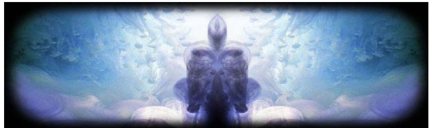
図2 光の煙が包み込む新映像アート「Haze」= Gil KUNO

CGがそのまま実用可能なプロダクトとして造形されて行く高度な実用を迎えた3Dプリント、空間そのものを別の感覚の世界に変えてしまうデジタルサイネージなど、メディア技術の実用はただ視聴するものから、日常やビジネスそのものを造形してしまう段階を迎えつつあります。見るだけでなく、聞くだけではない、実用される新しいメディアとは何か？ 逸早くそのことを知り、使うことにより、クリティカルに少し先を提示するファンタジスタたちの作品を通じて、体験して下さい。