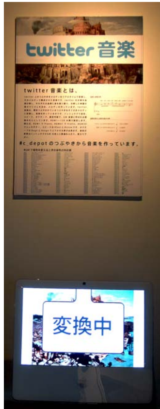
図 6「Twitter 音楽」松本祐一